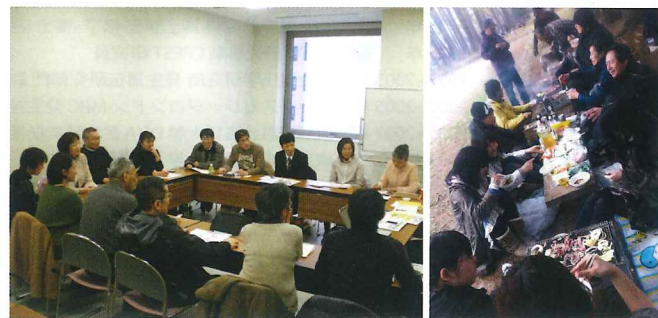
北海道 CUDO 会員の集い

北海道 CUDO では個人・法人会員を募集しています。私たちの目的・事業にご賛同していただける方ならどなたでも参加できます。色弱の方、色弱のお子さんを持つお母さん、色の専門家、デザイナーさんなどが参加しています。「会員の集い」では定期的にセミナー形式の勉強会や花見や忘年会など楽しいイベントも毎年、開催しています。お問い合わせ、お申込みは下記までご連絡ください。